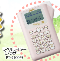
ラベルライター (ブラザー PT-J100P)

チラシ作り初心者向け ◀はじめの一歩賞 ※はじめの一歩賞は、 上位入賞作品以外から 選定します。