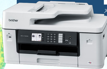
A3対応のハイスペック複合機 (ブラザー：MFC-J7100CDW)