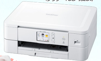
無線LAN搭載のシンプル複合機 (ブラザー：DCP-J526N)